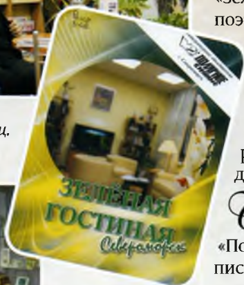
Обложка сборника «Североморск – Зелёная гостиная».