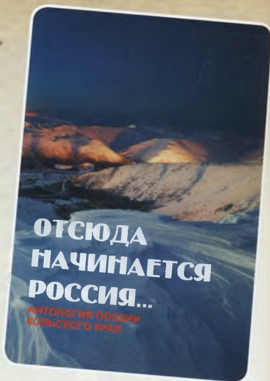
Обложка антологии поэзии Кольского края «Отсюда начинается Россия».