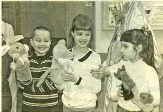
В среду помощниками Масленицы были ребята из 3«А» класса средней школы №12.