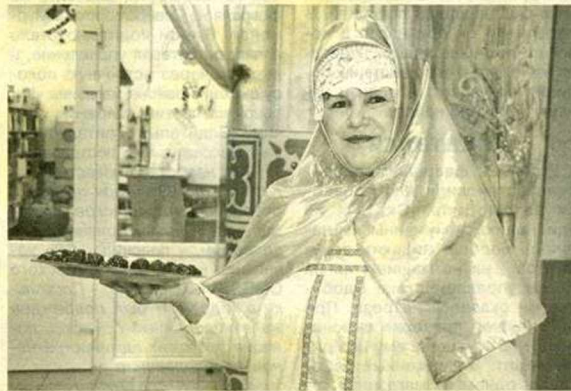
Государыня-боярыня Масленица от души потчует детвору главным угощением праздника - блинами.