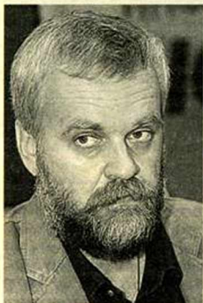
Алексей Варламов, исследователь-биограф.

Совсем скоро североморцам и всем жителям области представится уникальная возможность пообщаться с представителями современной литературной элиты и задать им свои вопросы. Авторы, чьи произведения самые востребованные и известные, посетят нашу область в рамках совместного проекта «Большая книга – встречи в провинции» Федерального агентства по печати и массовым коммуникациям и Фонда «Пушкинская библиотека». Главная цель акции – привлечь читательское и общественное внимание к лучшим произведениям современных авторов.