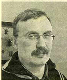
Илья Бояшов, известный документалист.