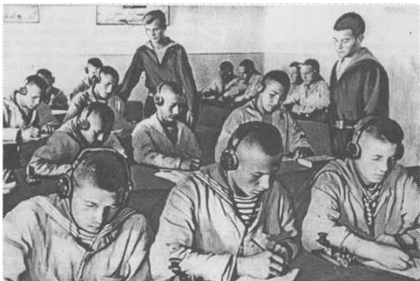
Юнги-радисты в учебном классе.

истосковались мальчишки по школьным партам. Всем очень хотелось поскорее попасть на корабли, успеть на войну. Юнги упорно овладевали морскими и военными знаниями, старательно изучали устройство боевых кораблей, оружие, специальные предметы, семафорную азбуку и многое другое. Учебная программа осваивалась досрочно. Вчерашние мальчишки готовили себя для действующего флота.