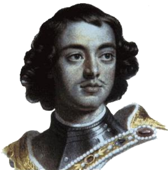
Портрет молодого Петра I. 1697 г. С портрета художника С.Г.Кнеллера.

4 августа в седьмом часу утра, распустив паруса, с пушечной пальбой в честь государя, иностранцы направились в море. Царь с палубы своей яхты наблюдал за ними и, как говорится в описании путешествия, «не скрывал своего восторга, любясь