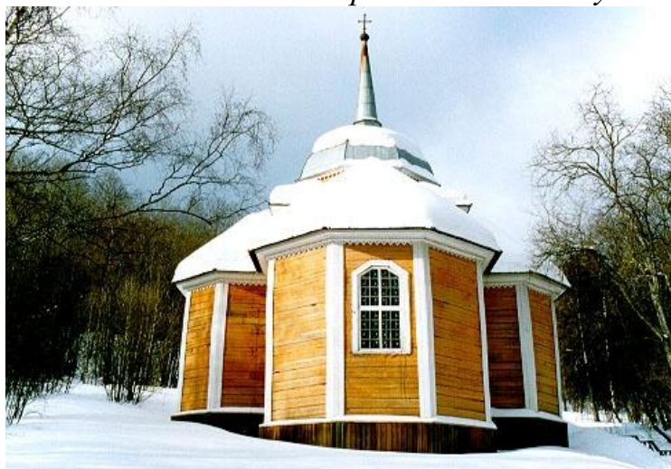
По указанию Петра I здесь была построена деревянная Церковь апостола Петра (1721)

А на чугунной доске, находящейся в павильоне на месте открытия первого источника, надпись гласит: «Сей источник исцелительной марциальной воды сыскан для пользы его царского величества Петра I императора всея российского и для прочей всенародной пользы тщением и искусством его величества всенижайшего раба артиллерии полковника и коменданта Олонецкого господина Георгия Вильгельма Геннина... и помянутой источник объявлен в прошлом 1716 году».