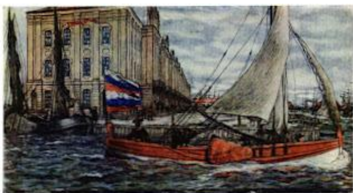
Е. Лансере. «Ботик Петра I» 1911 г.

13 июня 1688 года Петр I приехал на Плещеево озеро, где всецело отдался созданию переславской «потешной» флотилии.