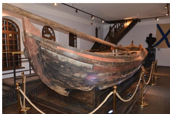
Ботик Петра I.