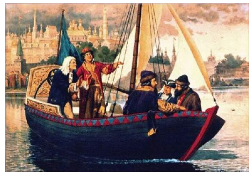
А. Кившенко. Петр I на ботике на реке Москва