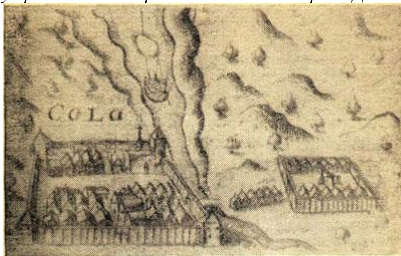
Кольский острог в конце XVI века (с голл. гравюры из книги Г. де Фера)

Первое упоминание о Коле содержится в финляндском источнике 1556 года. За отсутствием других, более ранних, свидетельств существования Колы можно считать год 1556-й временем зарождения русского поселка, ставшего впоследствии центром обширного края. Поселение возникло на мысу, образуемом реками Колой и Туломой при их впадении в Кольский залив. С каждым годом число поселенцев увеличивалось. В Колу прибывали поморы из Онеги и с Северной Двины.