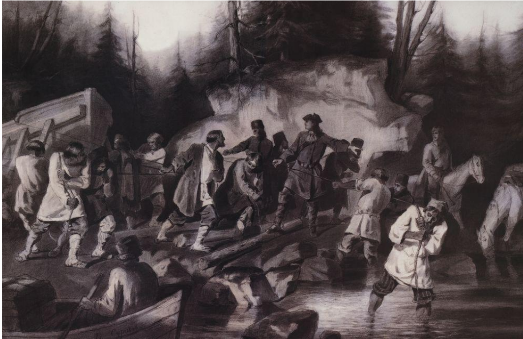
В. Суриков. «Петр I перетаскивает суда из Онежского залива в Онежское озеро в 1702 году» 1872г., рисунок карандашом.

Эта дорога предназначалась для доставки малых фрегатов «Святой Дух» и «Курьер», построенных в Архангельске, на Ладожское озеро для содействия войскам во взятии шведских крепостей.