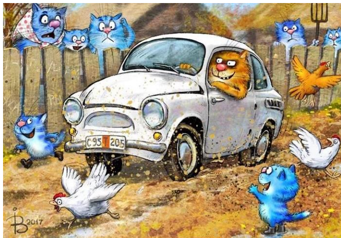
Автор рисунка: Рина Зенюк

111. Кулаков А. Психолог на дороге: миниатюра / А. Кулаков // Чем развлечь гостей. – 2008. - № 4. – С. 10-11.