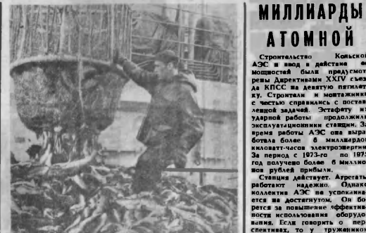
ПЯТУЮ ЧАСТЬ УЛОВА РЫБЫ В НАШЕЙ СТРАНЕ ДАЕТ МУРМАН.

Для дальнейшего укрепления в области материальной базы культуры предусматривается открыть не менее 40 массовых библиотек, построить кинотеатры по 100 мест в Мурманске и Оленегорске. Намечено строительство в городе Мурманске циркового комплекса на 1500 мест.