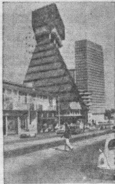
Абиджан — столица Республики Берег Слоновой Кости — считается одним из крупнейших и красивейших городов Западной Африки. Сейчас в нем проживает 850 тысяч человек.