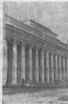
Казань. Свято чтут советские люди памятные места в столице Татарской АССР, связанные с именем В. И. Ленина. Здесь молодой В. Ульянов учился в университете, здесь начал свою революционную деятельность.