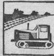
ТРАКТОРОВ В ТЫС. ШТУК