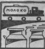
МОЛОКА В МЛН. ТОНН