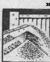
ЗЕРНА В МЛН. ТОНН