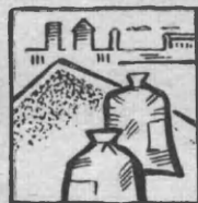
УДОБРЕНИЙ В МЛН. ТОНН