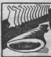
МЯСА В МЛН. ТОНН