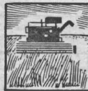
КОМБАЙНОВ ЗЕРНОВЫХ В ТЫС. ШТУК