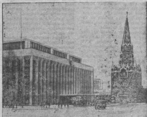
Москва. Кремлевский Дворец съездов и Троицкая башня.