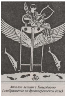
Аполлон летит в Гиперборею (изображение на древнегреческой вазе)

Видите, как далеко протянулись ниточки мифа. От Арктики к Индии и Древней Персии, к Греции и Риму. Даже некоторые греческие боги происходили из Гипербореи или были связаны с ней.