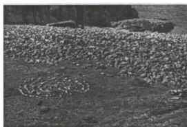
Расположение лабиринта в бугре Варана

В народных верованиях также сохранились предания о лабиринтах. Так, согласно легендам Ирландии и Англии, на спиральных лабиринтов в лунном свете танцевали феи, норвежские мифы повествуют, что лабиринты построены ледяными великанами – йотунами. А в шведских сагах лабиринты рассматриваются как путь в жилище карликов-цвергов, ювелиров и кузнецов, изготовлявших волшебное оружие для героев.